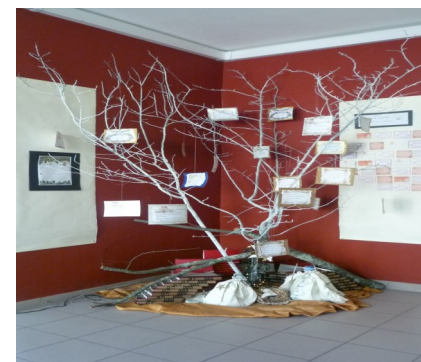
VIVER O NATAL

A biblioteca escolar lançou o desafio e toda a comunidade participou. Alunos de todos os anos de escolaridade e turmas, nas aulas de línguas, despertaram para o espírito natalício, em oficinas de escrita. Surgiram mensagens de apelo à Paz, Amor e Solidariedade. Estas deram vida à árvore de Natal e à Exposição no painel da entrada da BE.